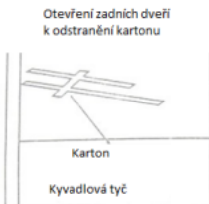
Obrázek č. 2

Opatrne odstráňte všetok obalový materiál, lepiace pásky a gumičky. Potom odstráňte kartón v smere šípok od kyvadla a odstráňte penovú hmotu z odbíjajúcich pružín (viď obrázok č. 2). Uistite sa, že sú hodiny postavené v bezpečnej a vzpriamenej polohe s uhlom naklonenia nižším ako 2 stupne.