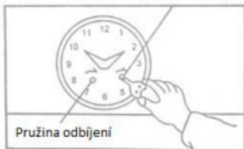
Obrázek č. 4