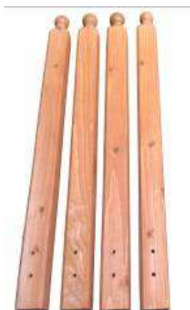
A - Sloupek – 4ks