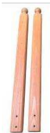
B - Sloupek – 2ks